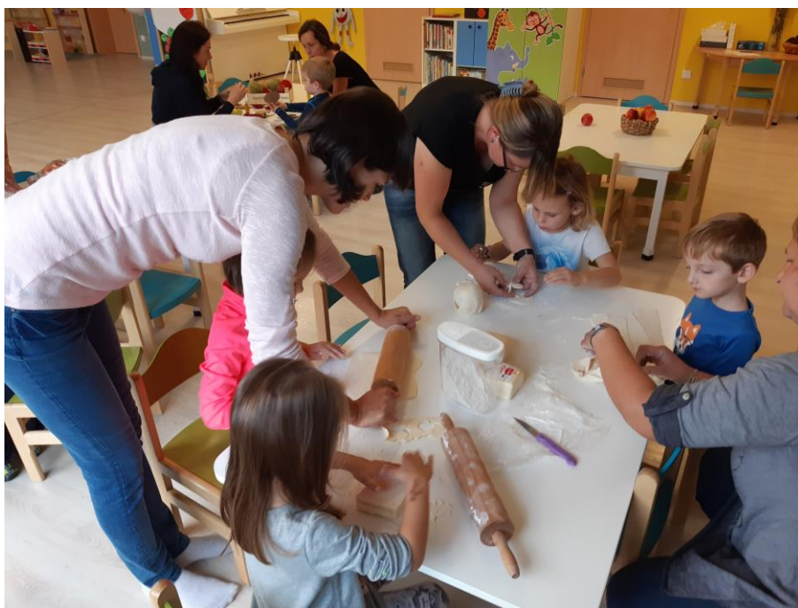
Jablíčkování ve třídě Včelek říjen 2021