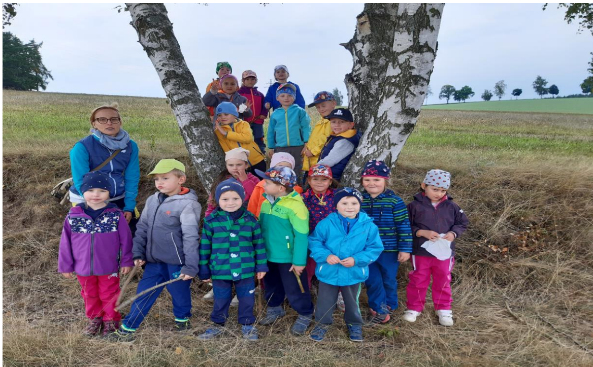
Škola v přírodě 17.9.2021

K Výstavišti 426, 25165 Ondřejov tel: 733 467 989 reditelka@msobecondrejov.cz www.msobecondrejov.cz