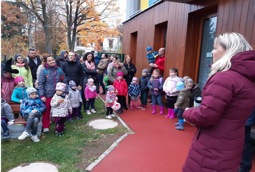
Uspávání broučků listopad 2021

K Výstavišti 426, 25165 Ondřejov tel: 733 467 989 reditelka@msobecondrejov.cz www.msobecondrejov.cz