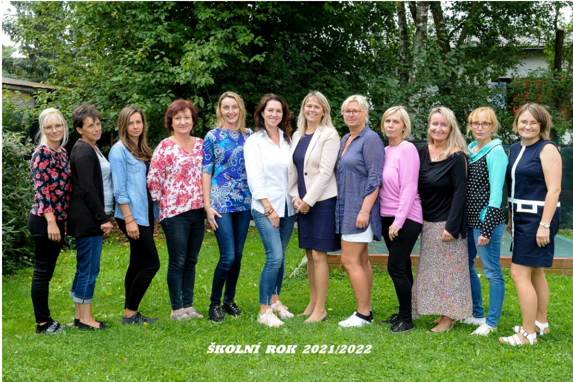
Kolektiv mateřské školy

K Výstavišti 426, 25165 Ondřejov tel: 733 467 989 reditelka@msobecondrejov.cz www.msobecondrejov.cz