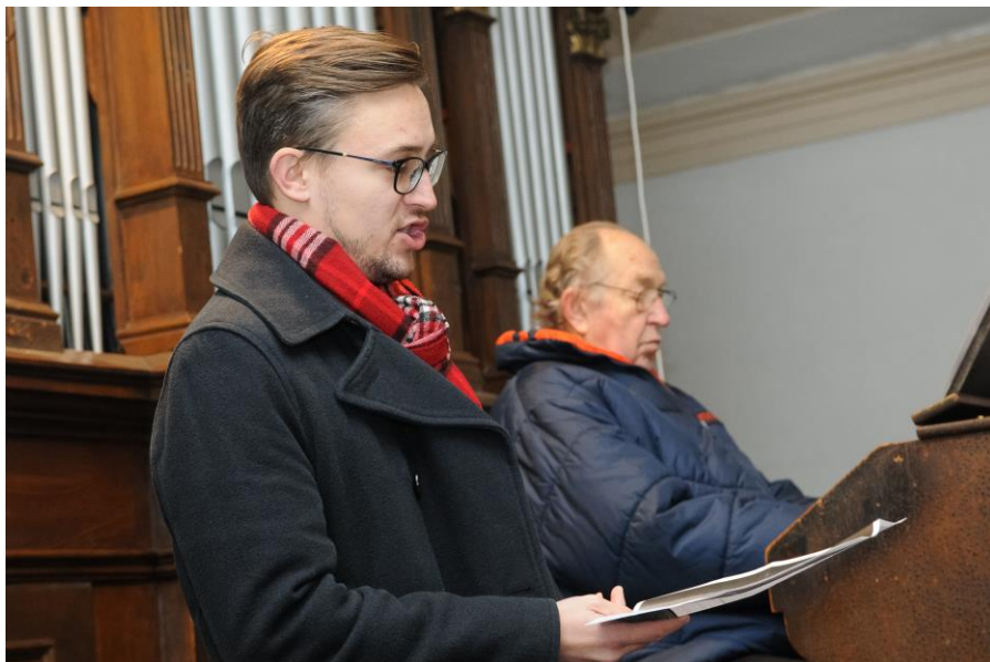
Zpívání v kostele 23.12.2021

K Výstavišti 426, 25165 Ondřejov tel: 733 467 989 reditelka@msobecondrejov.cz www.msobecondrejov.cz