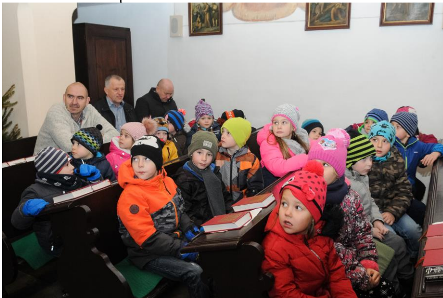
Zpívání v kostele 23.12.2021