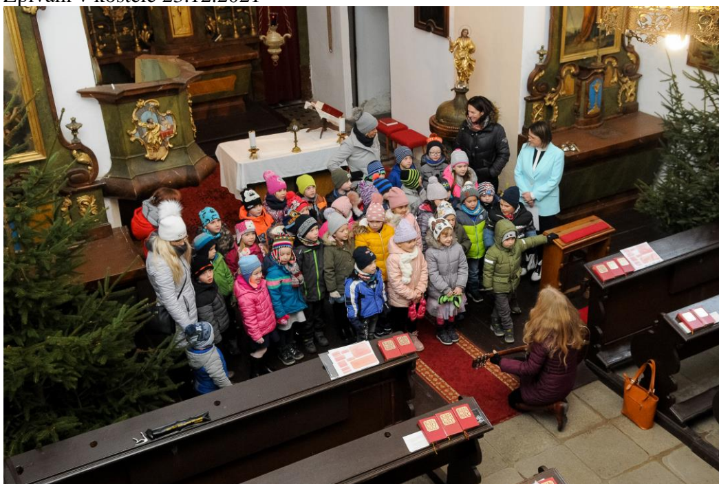
Zpívání v kostele 23.12.2021