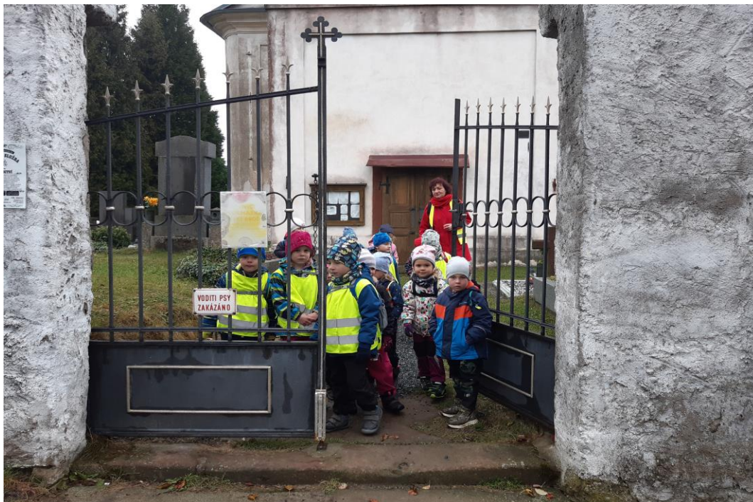
Třída Včelky návštěva hřbitova na Dušičky 2021

K Výstavišti 426, 25165 Ondřejov tel: 733 467 989 reditelka@msobecondrejev.cz www.msobecondrejev.cz