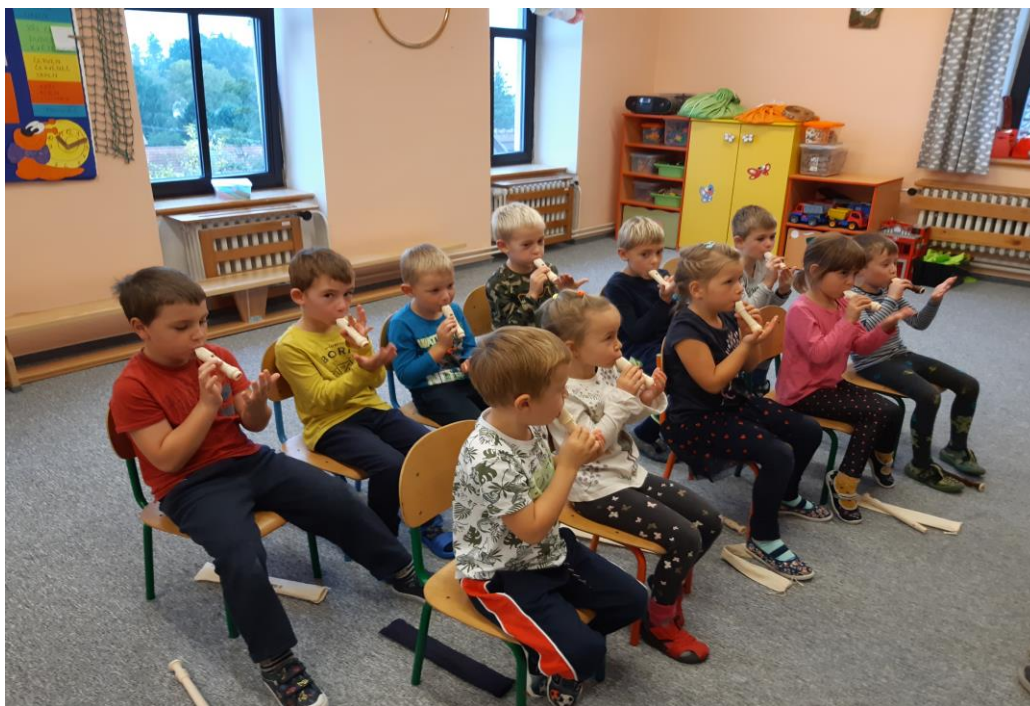
Hra na flétnu září 2021