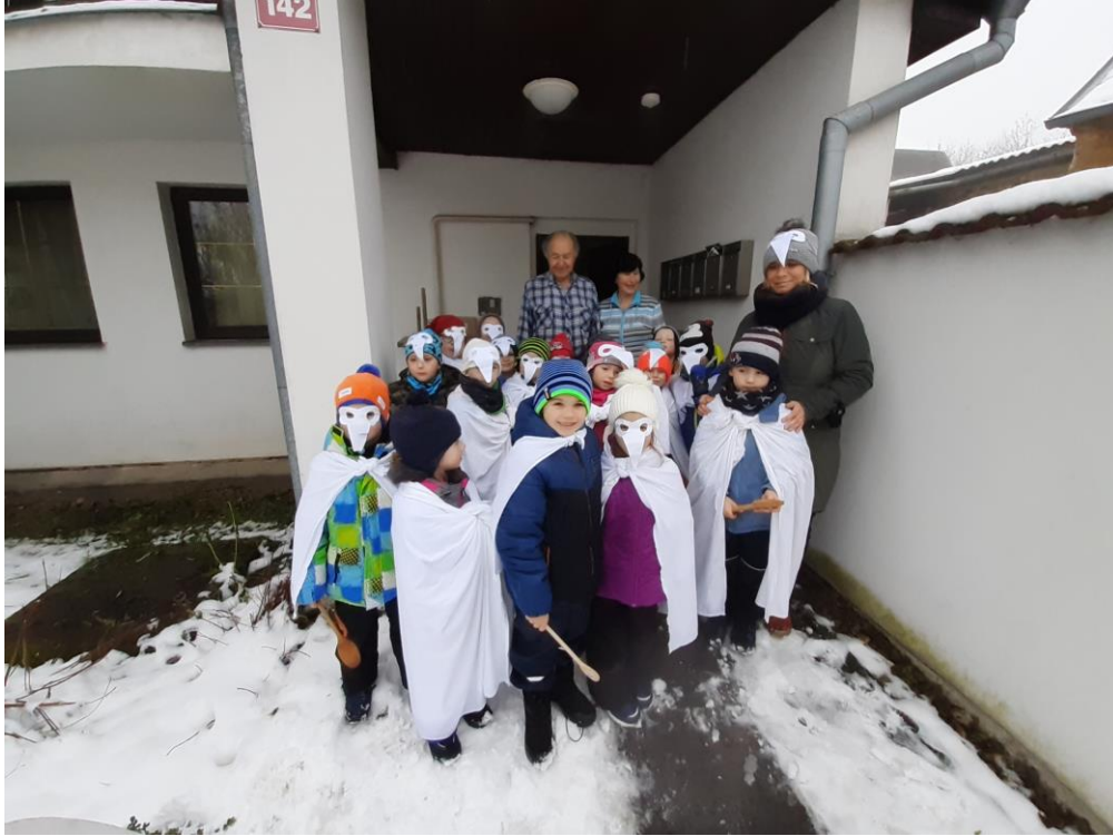
Svátek sv. Lucie: průvod v maskách 13.12.2021

K Výstavišti 426, 25165 Ondřejov tel: 733 467 989 reditelka@msobecondrejov.cz www.msobecondrejov.cz