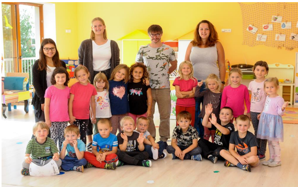
Prázdninový provoz 2021

K Výstavišti 426, 25165 Ondřejov tel: 733 467 989 reditelka@msobecondrejov.cz www.msobecondrejov.cz