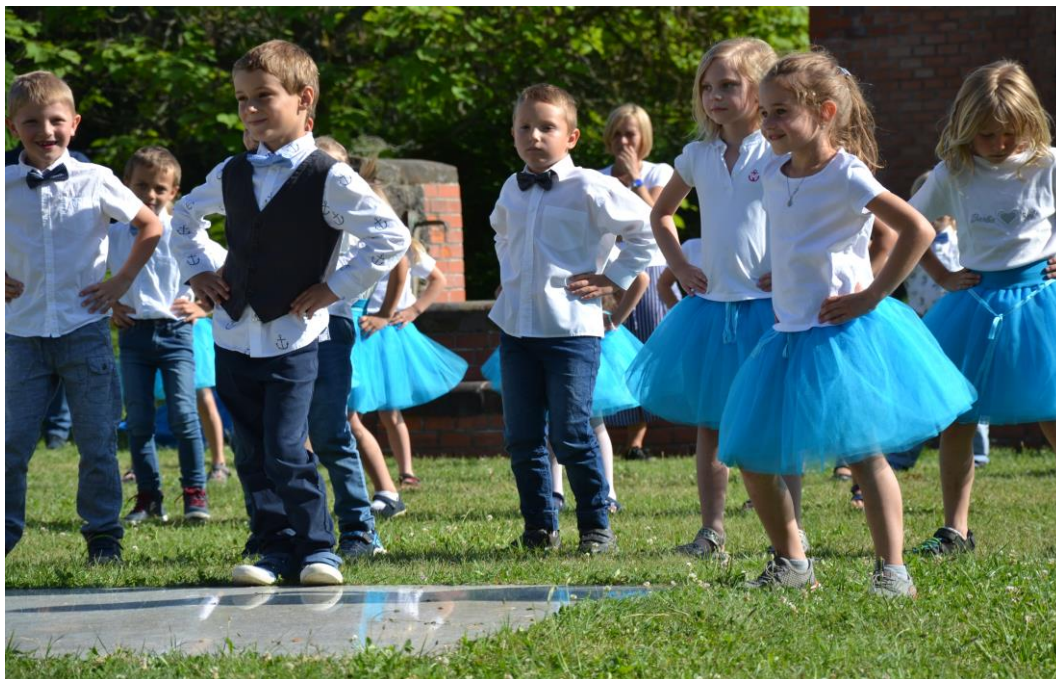
Rozloučení s předškoláky červen 2021