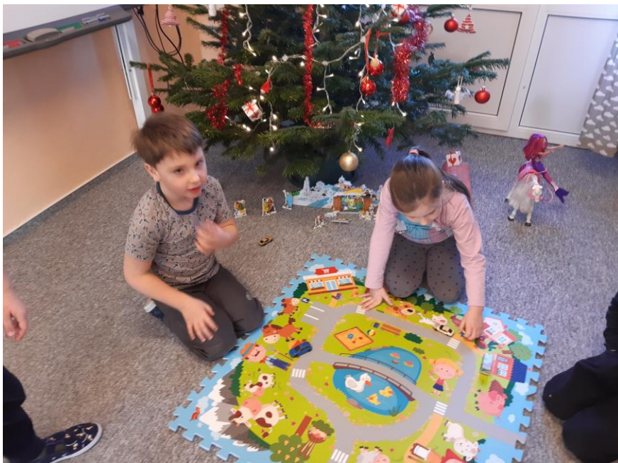
Vánoční nadílka třída Vážky 22.12.2021