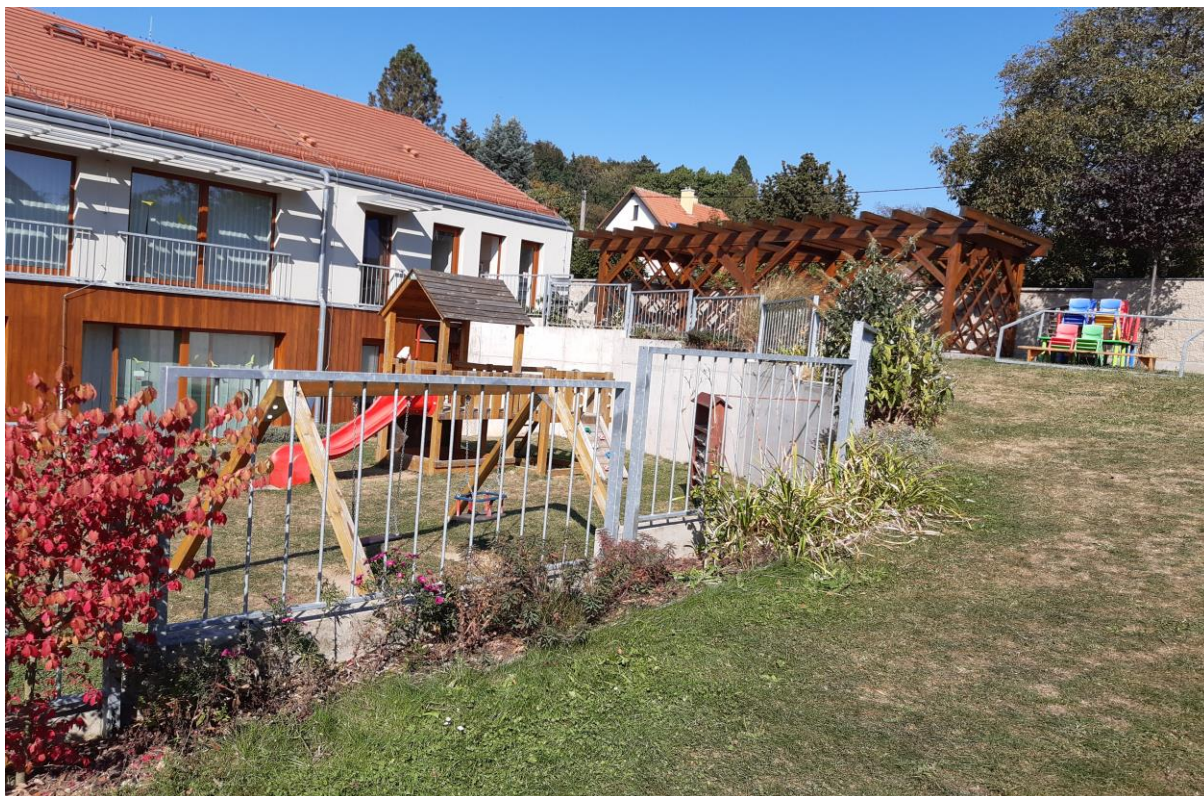
Zahrada budovy MŠ K Výstavišti 426